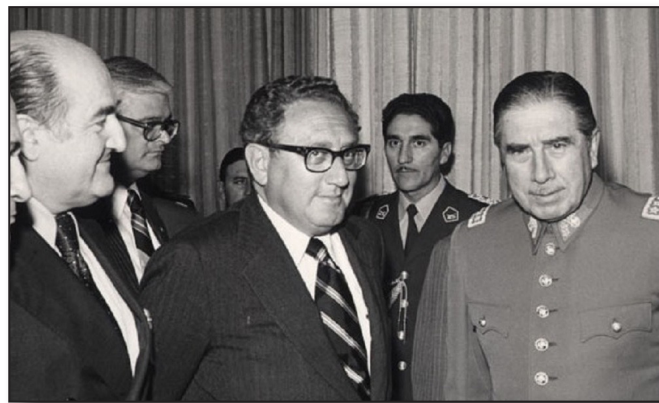
ژنرال پینوشه (سمت راست تصویر) در کنار وزیر امور خارجه‌ی آمریکا، هنری کسینجر

«چون قیامت شود، منادی‌ای ندا دهد: «کجایند ستمگران و یاران آن‌ها؟ هر کسی که دواتی برای آنان لایقه کرده، یا سرکیسه‌ای را برای آنان بسته، یا قلمی برای آنان در مرکب فرو برده است. پس آنان را نیز با ستمگران محشور کنید.» پیامبر اکرم (ص) «اگر بنی‌امیه کسی را نمی‌یافتند که برایشان بنویسد و مالیات جمع‌آوری کند و برایشان بجنگد و در جماعت‌شان حاضر شود، هرگز نمی‌توانستند حق ما را سلب کنند.» امام صادق (ع) ۲